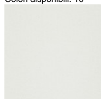
Stoff S1 - Steelcut 3 / Kvadrat Colori disponibili: 2