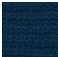
Stoff AL - Alba / FiDiVi Colori disponibili: 10