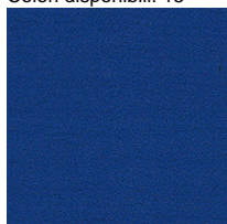
Stoff AB - Xtreme Plus / Camira Colori disponibili: 6