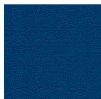
Stoff BN - Bondai / FiDiVi Colori disponibili: 6