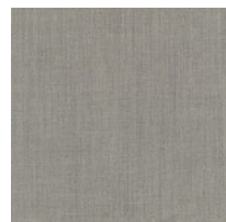
Stoff RM - Remix 3 / Kvadrat Colori disponibili: 10