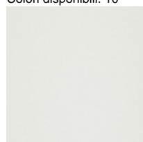
Stoff S1 - Steelcut 3 / Kvadrat Colori disponibili: 2