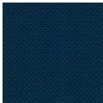
Stoff AL - Alba / FiDiVi Colori disponibili: 10