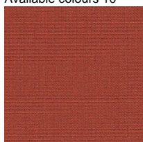
Fabric CS - Crisp / Gabriel Available colours 10