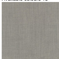
Fabric RM - Remix 3 / Kvadrat Available colours 10