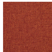
Tela ME - Medley / Gabriel Colori disponibili: 15