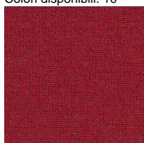
Tela MF - Main Line Flax / Camira Colori disponibili: 10