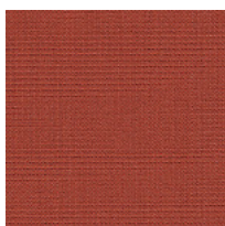
Tela CS - Crisp / Gabriel Colori disponibili: 10