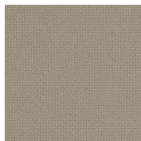
Tissu ST - Step / Gabriel Colori disponibili: 10