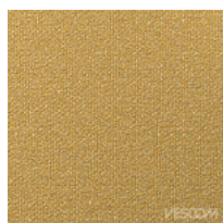
Tissu FT - Foster / Vescom Colori disponibili: 7