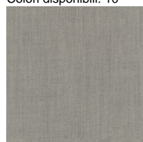
Tissu RM - Remix 3 / Kvadrat Colori disponibili: 10