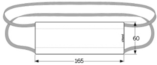
Misure mascherina (da indossare) Mask measurements (to wear)