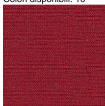
Tissu MF - Main Line Flaxe / Camira Colori disponibili: 10