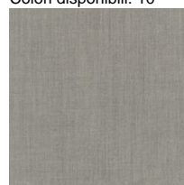
Tessuto RM - Remix 3 / Kvadrat Colori disponibili: 10