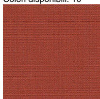
Tessuto CS - Crisp / Gabriel Colori disponibili: 10