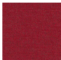
Tessuto MF - Main Line Flax / Camira Colori disponibili: 10