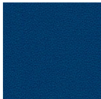
Tessuto BN - Bondai / FIDIVI Colori disponibili: 10