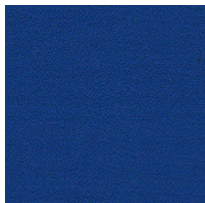
Tessuto AB - Xtreme Plus / Camira Colori disponibili: 10