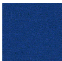
Tessuto AB - Xtreme Plus / Camira Colori disponibili: 10