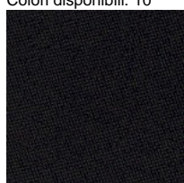
Tessuto CH - Chili / Gabriel Colori disponibili: 10

Questo prodotto è garantito 5 anni. Sitland si riserva di apportare modifiche e/o migliorie di carattere tecnico ed estetico ai propri modelli e prodotti in qualsiasi momento e senza preavviso. Le foto e i colori visualizzati sono puramente indicativi e possono variare rispetto alla realtà. Per maggiori informazioni si prega di contattare il nostro Servizio Clienti service@sitland.com