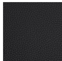
Pelle SX - Box Land / Dani Colori disponibili: 12